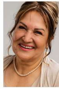
Sahrap Soysal TV Programcısı, Mutfak Araştırmacısı, Yazar