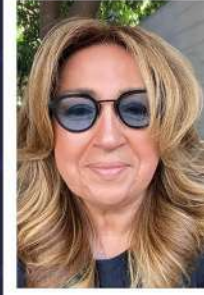
Kamer Kırış İşletmeci