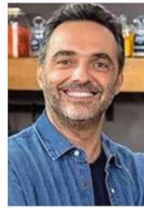
Arda Türkmen Şef, TV Programcısı