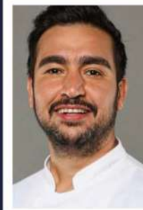
Türev Uludağ Şef, TV Programcısı